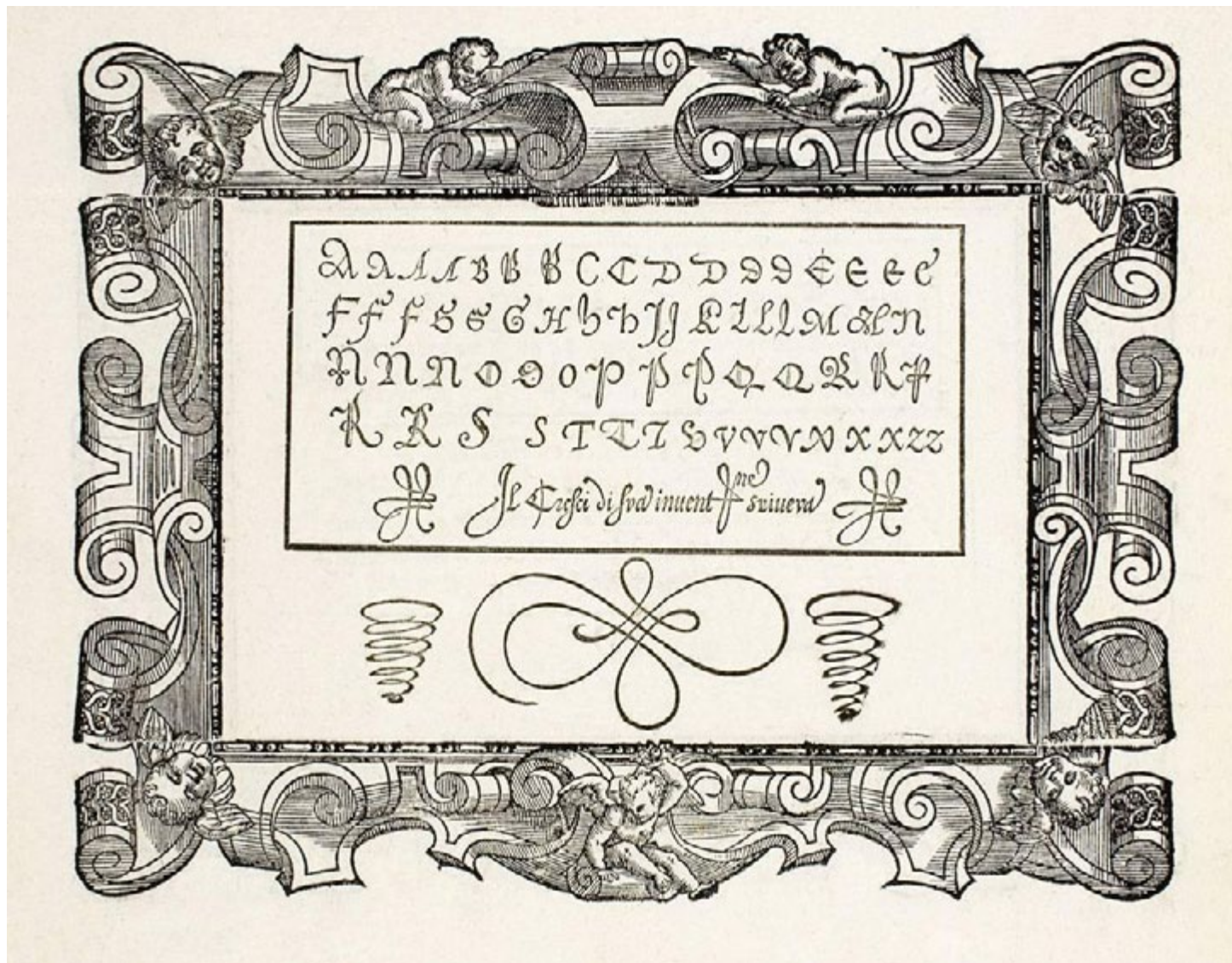
Das Kalligraphie-Büchlein des Italieners Gianfrancesco Cresci (aus Mailand), scriptore im Vatikan. Publiziert um 1570, also 20 Jahre vor Manuel Barata. Hat der Portugiese einige dieser Buchstaben kopiert?