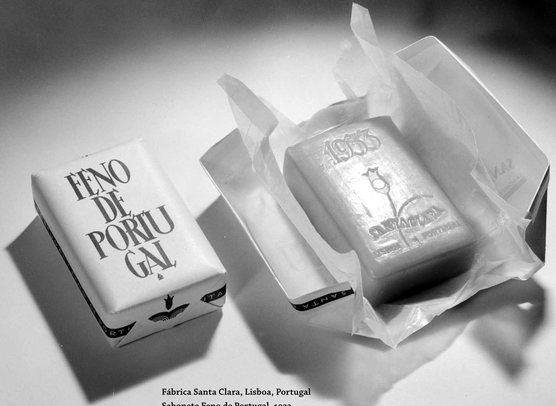
Fábrica Santa Clara, Lisboa, Portugal Sabonete Feno de Portugal, 1933